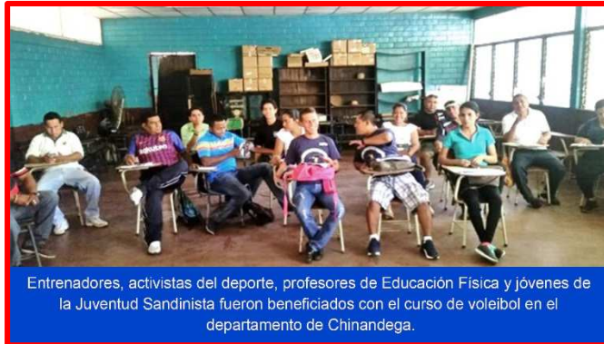
Entrenadores, activistas del deporte, profesores de Educación Física y jóvenes de la Juventud Sandinista fueron beneficiados con el curso de voleibol en el departamento de Chinandega.