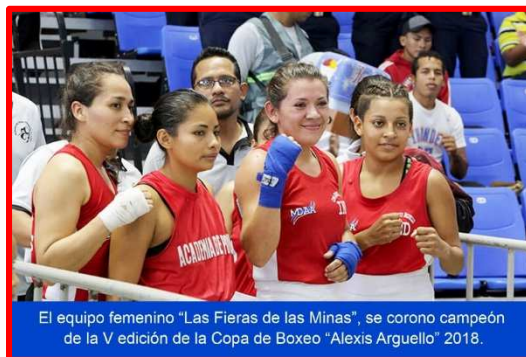
El equipo femenino “Las Fieras de las Minas”, se coronó campeón de la V edición de la Copa de Boxeo “Alexis Argüello” 2018.

Triángulo Minero ha sido constante aspirante a la corona. Ocupó el tercer lugar en el 2015 al