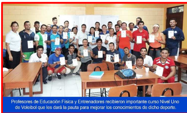
Profesores de Educación Física y Entrenadores recibieron importante curso Nivel Uno de Voleibol que les dará la pauta para mejorar los conocimientos de dicho deporte.