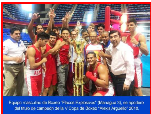
Equipo masculino de Boxeo “Flacos Explosivos” (Managua 3), se apodero del título de campeón de la V Copa de Boxeo “Alexis Argüello” 2018.

“Flacos Explosivos” (Managua 3) en masculino y “Las Fieras de las Minas” (Triángulo Minero) en femenino, se coronaron Campeones del Campeonato Nacional de Boxeo Superior, “V Copa Alexis Argüello” , que concluyó después de 5 meses de competencias, el fin de semana del 22 y 23 de Diciembre en el Gimnasio del Polideportivo “Alexis Argüello”, de la capital. La coronación de los “Flacos Explosivos” era esperada, especialmente por el desarrollo tenido en las últimas ediciones y tras derrotar y destronar en