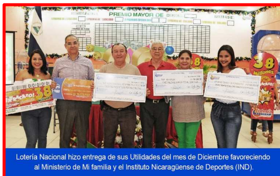
Lotería Nacional hizo entrega de sus Utilidades del mes de Diciembre favoreciendo al Ministerio de Mi familia y el Instituto Nicaragüense de Deportes (IND).

Lotería Nacional realizó la duodécima entrega de utilidades correspondiente al mes de diciembre, con un aporte de 11 millones 400 mil córdobas divididos en partes iguales al