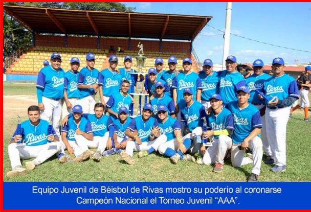
Equipo Juvenil de Béisbol de Rivas mostrando su poderío al coronarse Campeón Nacional el Torneo Juvenil “AAA”.

Las competencias del béisbol pinolero en sus diferentes categorías continuaron firmes y en el