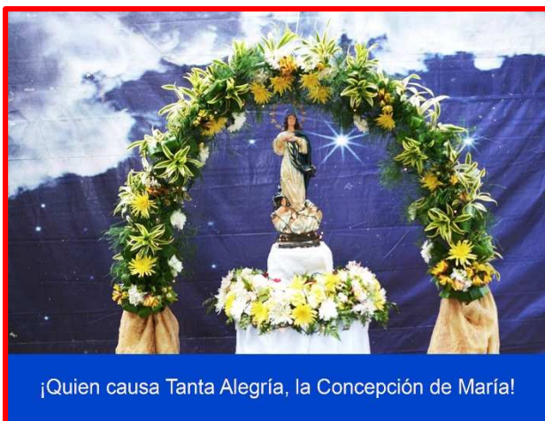
¡Quien causa Tanta Alegría, la Concepción de María!

El viernes 6 de diciembre los trabajadores del Instituto Nicaragüense de Deportes (IND), vivieron una gran fiesta llena de mucha fe y religiosidad al festejar el último día de los rezos a la ¡Santísima Virgen María! (iniciaron en los últimos días de noviembre).