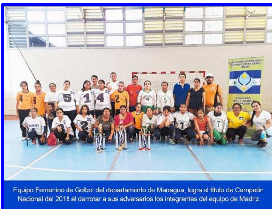
Equipo Femenino de Golbol del departamento de Managua, logra el título de Campeón Nacional del 2018 al derrotar a sus adversarios los integrantes del equipo de Madriz.